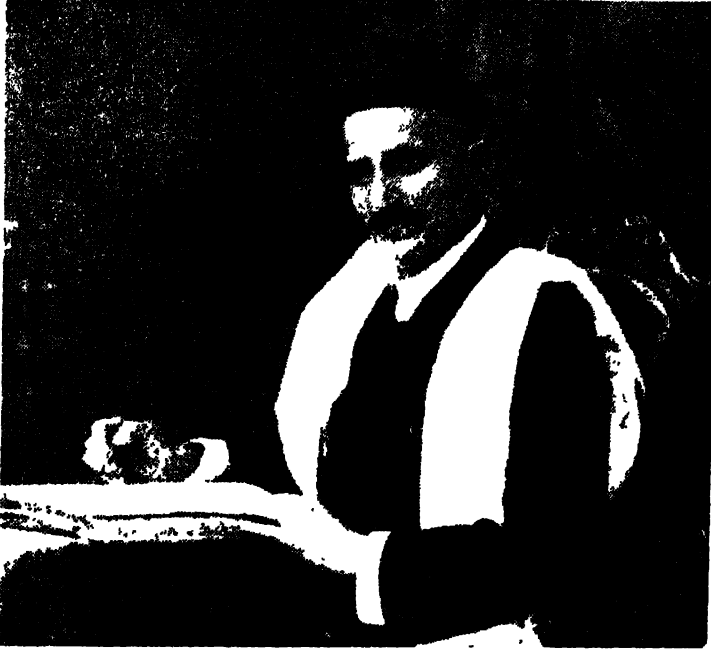
स्व० विष्णुनारायण भातखण्डे